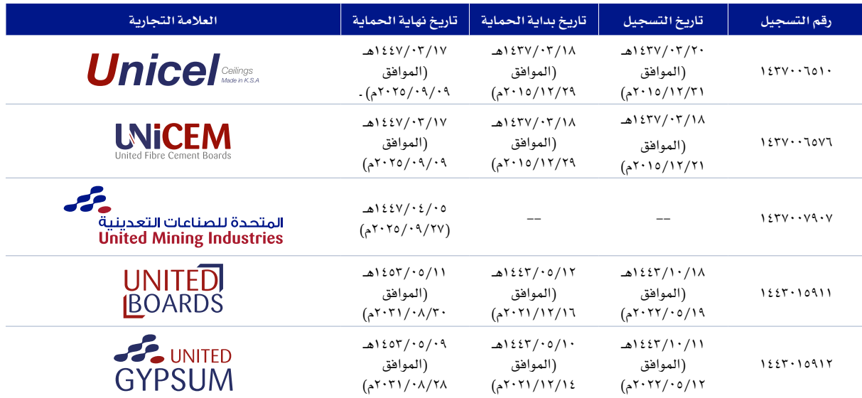
الجدول رقم (٤١): العلامات التجارية

لدى الشركة خمسة (٥) شعارات تستخدمها في تعاملاتها التجارية وقد تم تسجيلها كعلامات تجارية لدى وزارة التجارة (فيما بعد انتقلت صلاحية تسجيل العلامة التجارية للهيئة السعودية للملكية الفكرية، تحت الفئة (١٩) وهي إحدى فئات العلامات التجارية والتي تختص بمواد البناء (غير المعدنية)، أنابيب قاسية غير معدنية للمباني، أسفلت وزفت وقار، مباني غير معدنية قابلة للنقل، نصب (مجسمات) غير معدنية. يبين الجدول التالي التفاصيل المتعلقة بالعلامات التجارية: