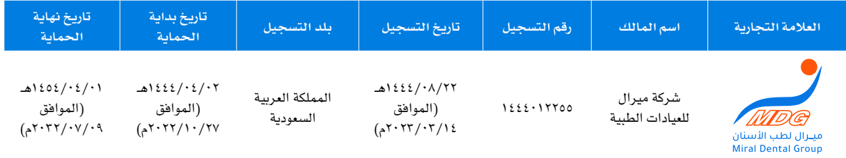
الجدول رقم (١١): العلامة التجارية للشركة

تعتمد الشركة في تسويق منتجاتها على علامتها التجارية، والتي تدعم أعمالها ومركزها التنافسي، وتمنحها تميزاً واضحاً في السوق بين العملاء. ويوضح الجدول أدناه العلامة التجارية التي قامت الشركة بتقديم طلب لتسجيلها.