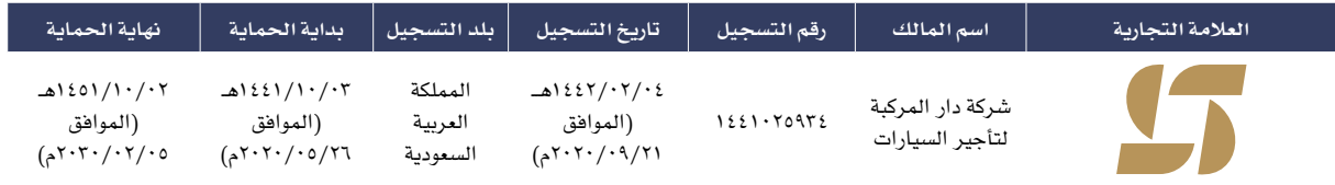
الجدول رقم (٣٤): العلامات التجارية وحقوق الملكية

المصدر: شركة دار المركبة لتأجير السيارات.