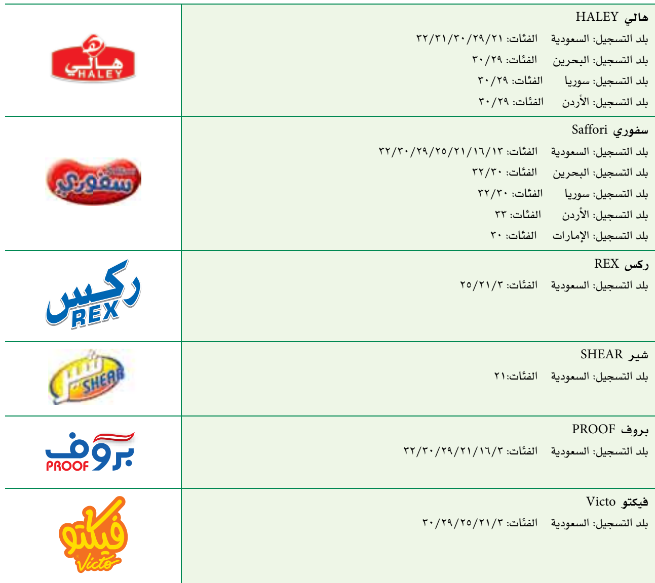
الجدول ٧٦: العلامات التجارية المملوكة للشركة

كما أنها تعتبر جزءاً من الخطط الإستراتيجية طويلة الأجل للشركة، حيث أنها تقوم ببناء صورة مميزة وتخلق عنصراً من عناصر التفاضل بين المتنافسين في السوق.